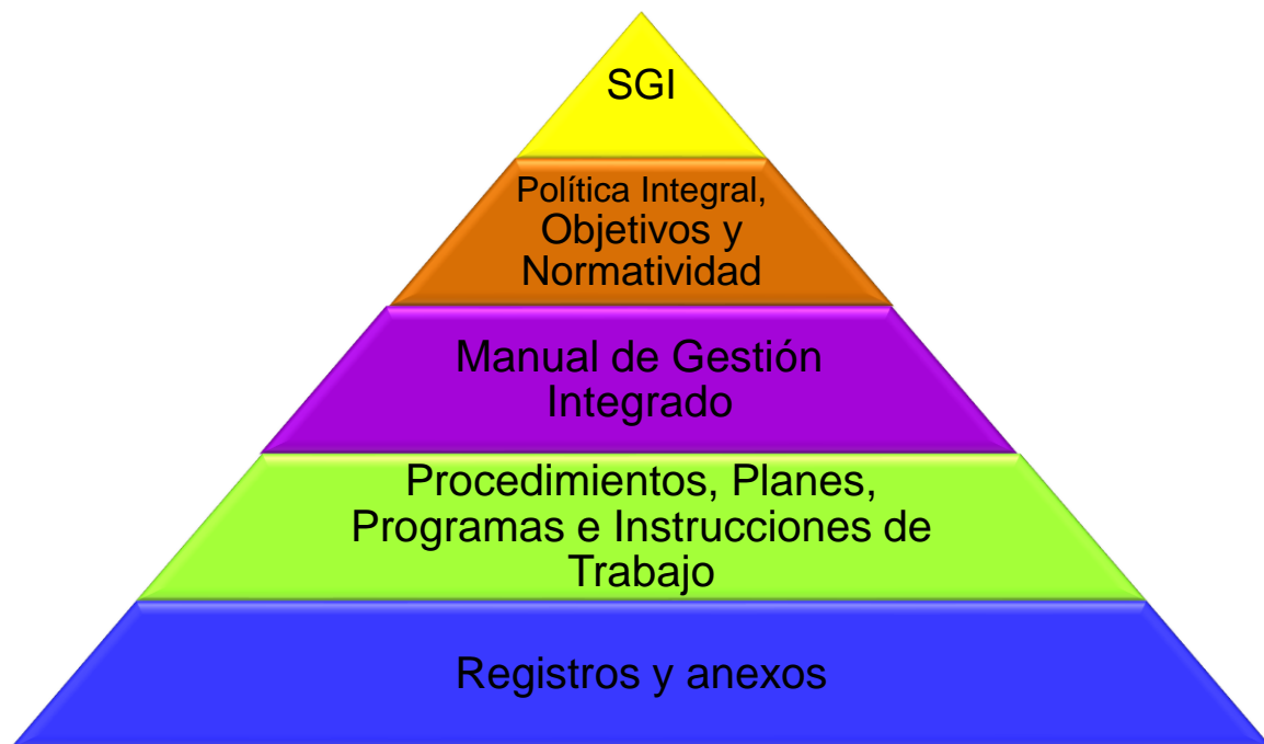
Modelo de la documentación del SGI.